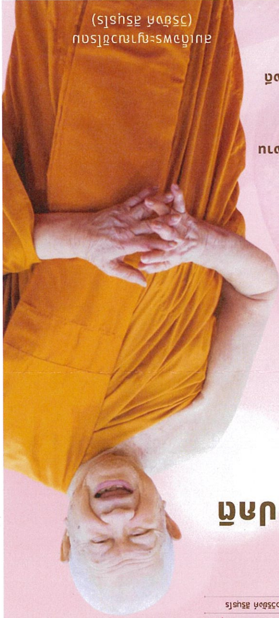
(ស្រីស្រី អង្គការ) មន្ទីរពេទ្យស្រីស្រី

ឆ្នាំ ២០២៤ : ១៤៧៤ ឆ្នាំ ២០២៤ ១៤៧៤ ឆ្នាំ ២០២៤ : ២០២៤ រាជធានីភ្នំពេញ រាជធានីភ្នំពេញ រាជធានីភ្នំពេញ រាជធានីភ្នំពេញ