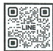
QR-Code ใบสมัคร QR-Code เพื่อสอบถามข้อมูล