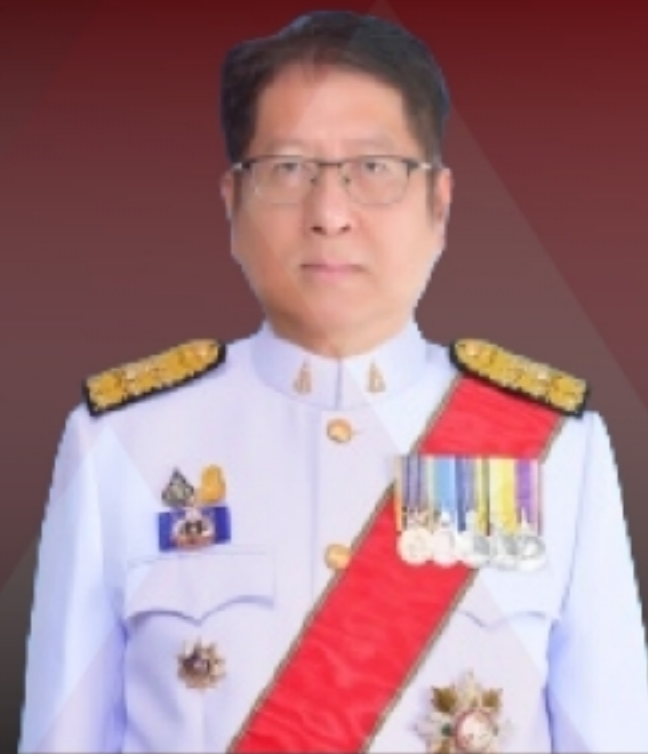
ท่านไพรัช พรมบูรณ์ศิริ อัยการสูงสุด