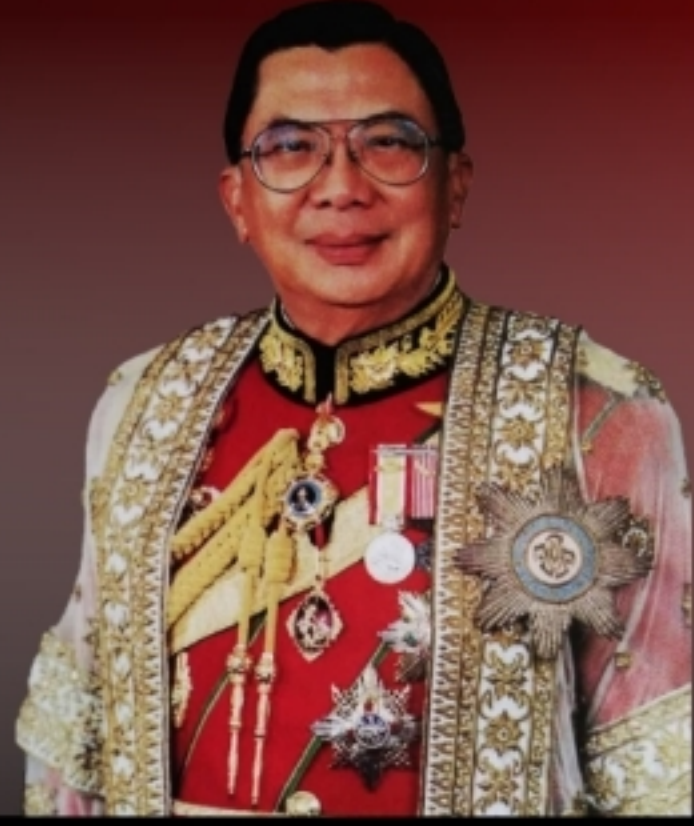
พล.อ.ชวลิต ยงใจยุทธ อดีตนายกรัฐมนตรี