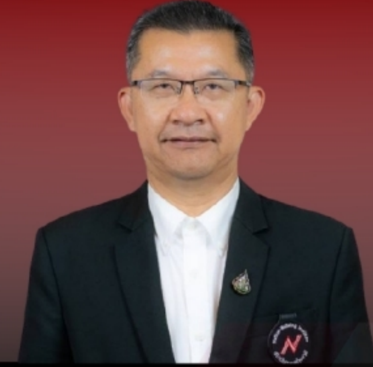
ดร.ธีรภัทร ประยูรสิทธิ อดีตนายกรัฐมนตรี อดีตนายกรัฐมนตรี