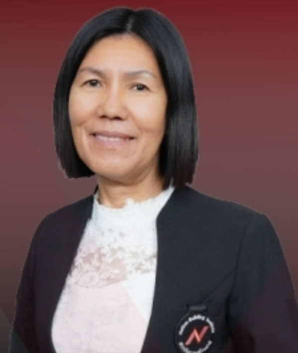
ท่านประทุมพร กำเหนิดฤทธิ อธิบดีผู้พิพากษา ศาลอาญาคดีทุจริตและประพฤติมิชอบ ภาค 9