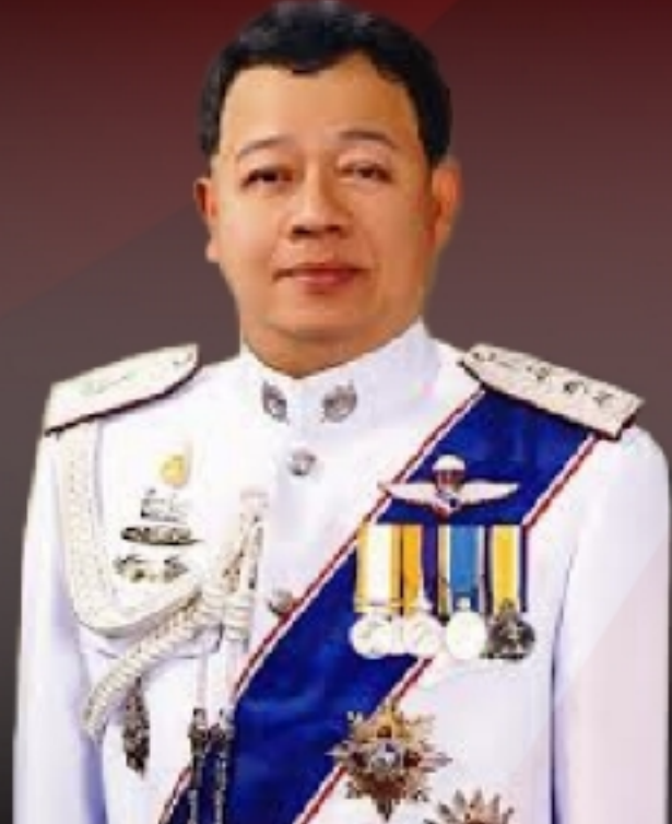
พล.ต.อ.ดร.เรืองศักดิ์ จริตเอก อดีตรองผู้บัญชาการตำรวจแห่งชาติ สมาชิกสภานิติบัญญัติ ที่ปรึกษารัฐมนตรีว่าการกระทรวงยุติธรรม