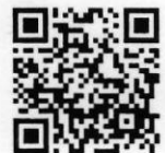
QR-Code เพื่อจองห้องพัก

โทรศัพท์: ๐๒-๔๒๒-๙๒๒๒ E-mail : rsvn@royalriverhotel.com